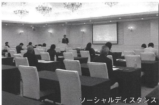
ソーシャルディスタンス